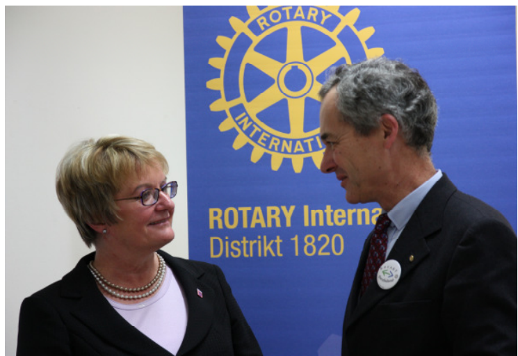
Schirmherrin und Distriktgovernor im Gespräch

Die Rotarierinnen und Rotarier in Hessen geben mit Schüler fragen - Profis antworten ein unvergleichliches Informationsangebot, für das ich gerne die Schirmherrschaft übernommen habe. Wenn Führungskräfte sich mit Schülern abends persönlich an einen Tisch setzen, um bei der Findung des richtigen Ausbildungsweges mit ihren Erfahrungen beizutragen, dann ist das eine großartige Sache. Ich danke den Rotary Clubs, ihren Mitgliedern und den Kooperationspartnern für ihr selbstloses Engagement.